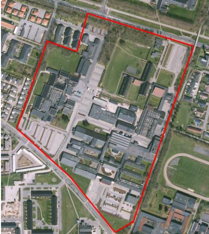
Døesvej 70 - 76